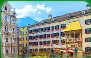
หลังคาทองคำ อินส์บรุค