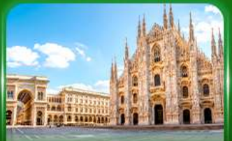
มหาวิหารดูโอโมแห่งมิลาน