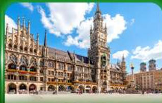
จัตุรัสมาเรียนพลัทซ์ มิวนิก