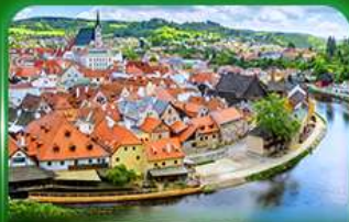
เมืองมรดกโลก เซสท์ครุมลอฟ