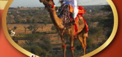
ฟรี ژیอูรู เมืองมันทอวา ราคาเริ่มต้น