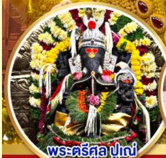
พระตรีศูล ปูणे (Trishul Pune)