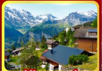
หมู่บ้านเมอร์เสน