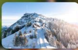
พิชิต 3 ยอดเขาคิง Rigi / Schilthorn / Gornergrat