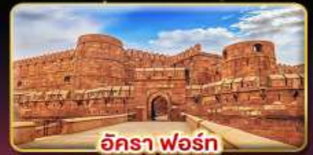
อัครา ฟอรั