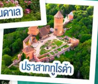
ปราสาทกุโรต้า